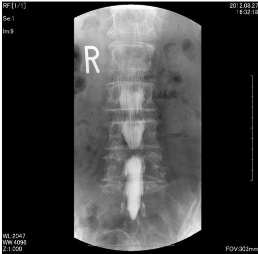
脊髄腔造影(ミエログラフィー)

当院では、主に脊髄腔造影や神経根ブロック、椎間板造 影の検査などで使用致します。