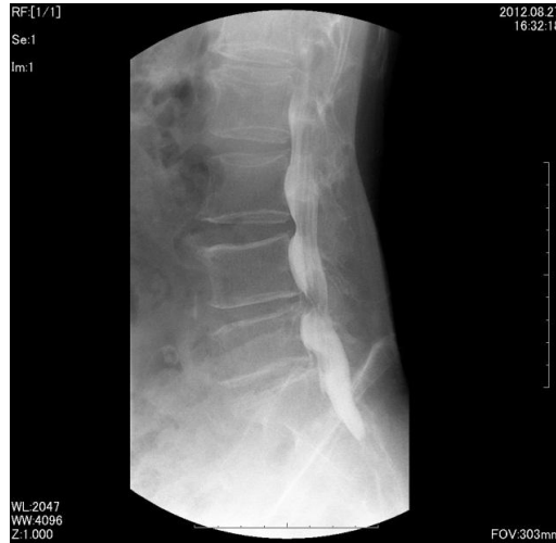
脊髄腔造影(ミエログラフィー)