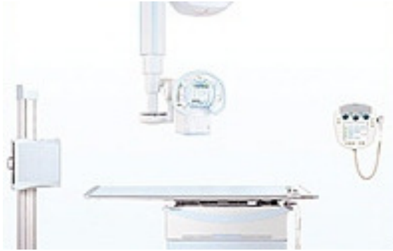
一般撮影システム

整形外科領域で必要とされる、複雑な角度の撮影も自在に行える天井走行式X線管懸垂器を組み合わせており、全身の様々なレントゲン撮影に対応しております。